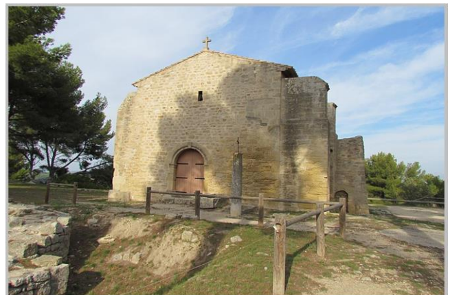
Chapelle de Saint-Blaise

Par l'avenue Radolfzell, dirigez-vous vers Rassuen pour prendre la D52, dite « Route de la Cabane Noire ». Vous longerez les salins de Rassuen avec sa flore et sa faune aviaire. Peut-être aurez-vous la chance de voir des flamands roses, voire des cigognes, tôt le matin.