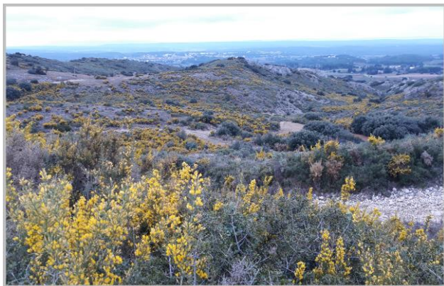
Charleval, Le Plateau de Cèze

En arrivant sur Alleins , vous apercevrez les ruines du château datant du XV ème siècle avec sa tour escalier qui permettait autrefois l'accès au village. Au cœur du bourg, le beffroi orné de son beau campanile donne accès au centre du village ancien rénové afin de mettre ce patrimoine en valeur. Depuis Alleins, continuez vers l'Est en direction de Charleval, par la D561, distant de 7 km.