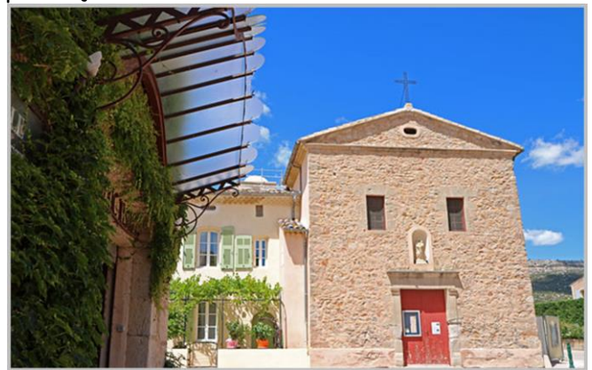
Fuveau, Chapelle St Michel

Au départ de Peynier, prenez la direction d'Aix-en-Provence par la tranquille D57A en traversant le petit hameau des Michels pour rejoindre Fuveau. Fuveau , agréable bourg avec la Sainte-Victoire en toile de fond, a su se développer ces dernières années tout en conservant son authenticité provençale.