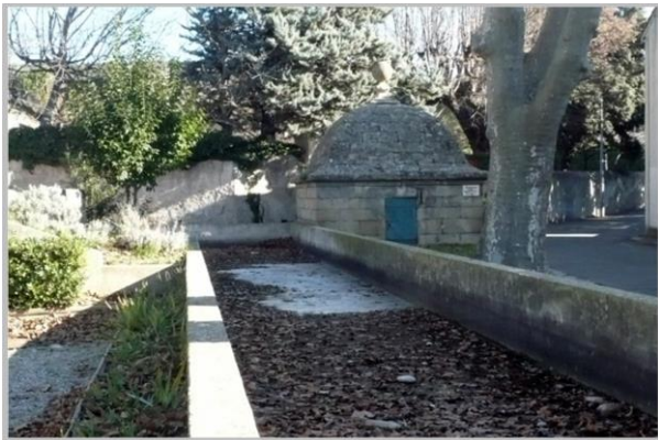
Eyguières, La fontaine des Bormes

Quelle que soit la saison et la température, été comme hiver, l'eau coule toujours à Eyguières... Vous pourrez y admirer de belles fontaines, entre autres la fontaine Coquille, la fontaine Cocotte ou encore la fontaine des Bormes et y faire le plein d'eau fraîche.