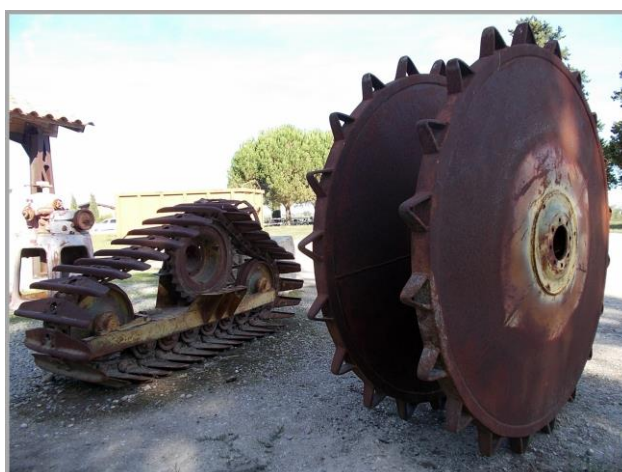
Outillages pour les rizières

Au cœur du village trône l'église forteresse romane, Notre Dame de la Mer, classée monument historique depuis 1840 et la crypte Sainte Sarah, patronne des gitans. L'église a été érigée entre le IX ème et XI ème siècle sur un ancien sanctuaire gallo-romain et a remplacé un oratoire établi selon la légende des Saintes. Sa fortification a été décidée suite aux attaques répétées des sarrasins.