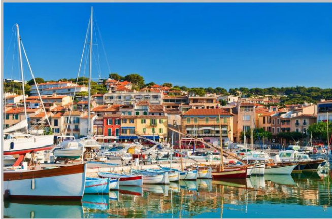
Cassis, le Port

Pour le retour, le circuit vous amène sur Carnoux-en-Provence, petite bourgade entourée de garrigues et collines odorantes qui a vu le jour qu'en 1967 grâce à quelques français rapatriés du Maroc qui cherchaient un coin de Provence pour s'installer.