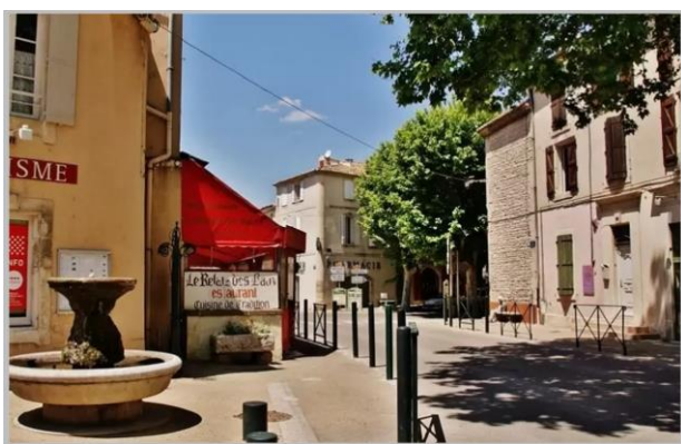
Mouriès, le Village

Le premier circuit proposé, au départ de Mouriès, vous fera découvrir la partie Nord-Ouest du département avec Arles , point de contrôle du circuit et site BCN/BPF des Bouches-du-Rhône.