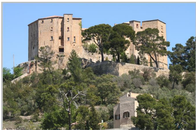
Meyrargues, son château féodal

élevée du département des Bouches-du-Rhône après Mimet. De grandes bastides et quelques châteaux témoignent de l'époque dorée de la campagne d'Aix au XIX ème siècle. Par Saint-Canadet, rejoignez Meyrargues, village médiéval blotti dans la vallée de la Durance, au pied du château féodal «Albertas», du nom de la famille qui l'a transformé au XVII ème siècle.