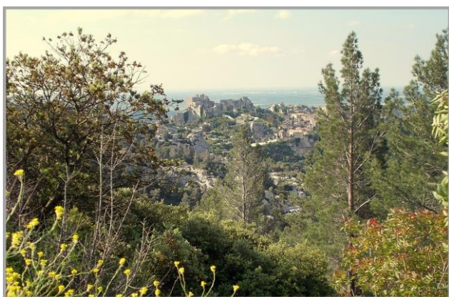
Les Baux de Provence

Le deuxième circuit , toujours au départ de Mouriès , vous amènera rapidement vers les Baux-de-Provence par de sympathiques petites routes à travers de magnifiques paysages des Alpilles. Le Village des Baux-de-Provence est bâti sur un plateau rocheux à 245 m d'altitude. Il domine des paysages exceptionnels et il est classé et labellisé parmi les plus beaux villages de France.