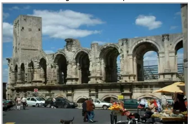
Arles, les arènes

Fontvieille , village pittoresque, où les vieilles maisons sont construites avec les pierres des fameuses carrières datant du XV ème siècle. Direction la D17, pour rejoindre l'abbaye de Montmajour, déjà croisée lors du circuit n°1, puis entrer dans la ville romaine d'Arles, également sur le premier circuit.