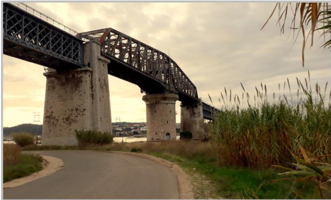
Martigues, Pont tournant de Caronte

Malheureusement, le terrible incendie de juillet 2018, un jour de fort Mistral, a ravagé une grande partie de la pinède, rendant le paysage lunaire. Contournez l'étang de Pourra par votre droite et rejoignez la D50 qui vous conduit vers l'entrée du Domaine de Castillon puis vers la zone artisanale de la Grand Colle sur la commune de Port de Bouc. 8 km vous séparent de Martigues que vous atteindrez en longeant le canal de Caronte via la Zone artisanale de la Gafette.