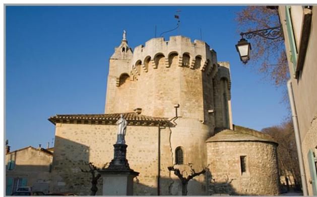
Saint-Andiol, l'église Saint-Vincent

Par les chemins vicinaux, dirigez-vous vers Saint-Andiol en bordure de la Durance installé entre le massif du Luberon et les Alpilles.