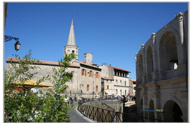
Arles, Près des Arènes

Saint-Martin-de-Crau traversé, dirigez-vous vers Moulès, puis Pont-de-Crau pour entrer dans Arles par son côté Est. Arles , une visite s'impose dans cette commune la plus grande de France avec ses 75 000 ha, porte de la Camargue.