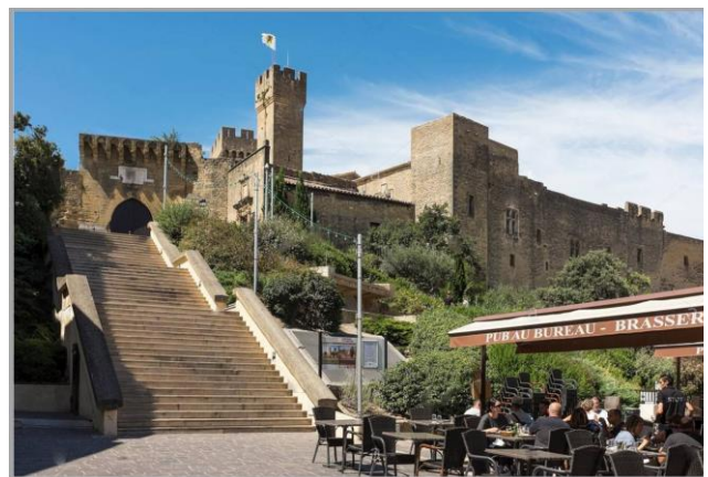
Salon de Provence, Le château de l'Empéri

A Salon-de-Provence , prenez le temps de visiter le centre-ville, le château de l'Empéri et son musée ainsi que les savonneries de la ville qui font sa renommée.