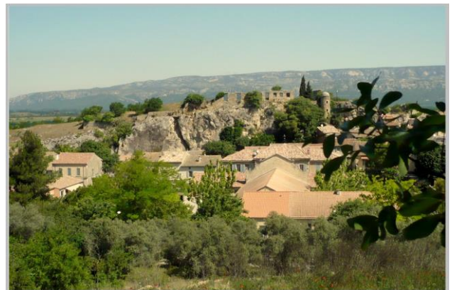
Alleins, le village

A la sortie de Sénas, soyez prudent vous êtes proche d'un nœud autoroutier avant de prendre la direction d'Alleins, par la D71, route sur laquelle vous ne rencontrez que très peu de voitures.