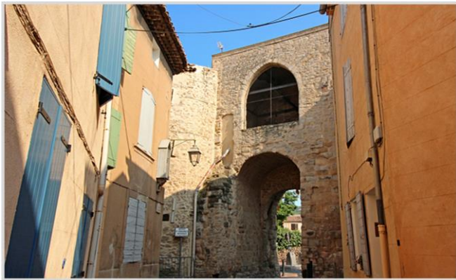
Trets, la porte de Pourrières

Par la D908 puis l'ancien chemin de Peynier à Trets, rejoignez cette ancienne cité médiévale, Trets bordée par la montagne du Regagnas au sud et les monts Aurélien à l'Ouest.