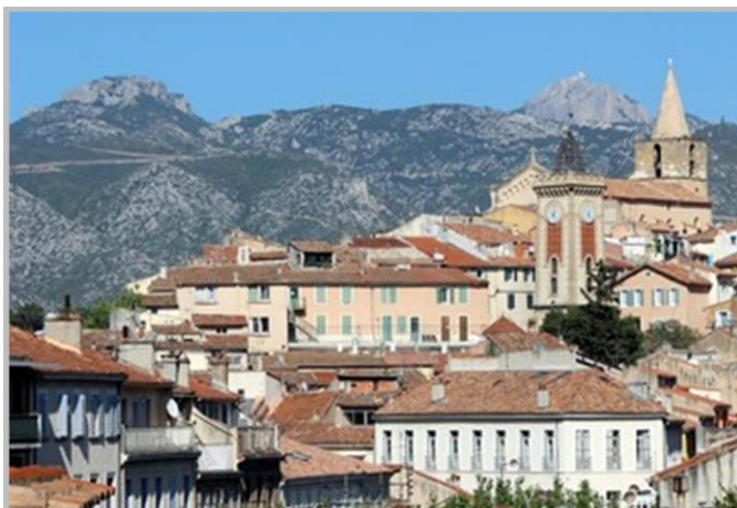
Aubagne avec Le Garlaban en toile de fond

De Carnoux, vous contournez Aubagne par l'Est avant de remonter sur Auriol, Belcodène et retrouver Peynier. Mais avant de rentrer, prenez le temps de visiter Aubagne, ville natale du célèbre Marcel Pagnol. Cet écrivain cinéaste, qui a passé toute sa jeunesse à Aubagne, a su célébré la Provence et sa culture à travers des personnages pittoresques. Aussi c'est avec fierté que la ville lui consacre expositions et circuits touristiques. Les sols argileux de cette région ont su être exploités depuis l'Antiquité pour fabriquer amphores, céramiques fines et santons, faisant d'Aubagne la capitale des santons de Provence.