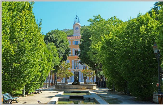
Gémenos, la Mairie

Madeleine décida il y a près de 2 000 ans, de finir ses jours dans la prière.