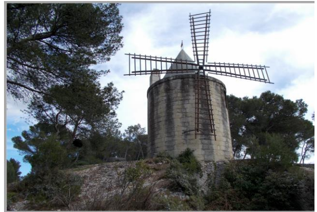
Barbentane, son Moulin

Bâtie sur le versant nord de la Montagnette, Barbentane domine toute la plaine fertile et maraîchère longeant le Rhône.