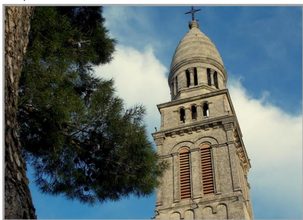
Orgon, Chapelle ND-de-Beauregard

direction Orgon en longeant la frontière vaclusienne par le sud de Cavaillon. Comme de nombreux villages traversés, Orgon est un village très ancien attesté par des vestiges de la période néolithiques, des traces d'occupation romaine par des statues, des sépultures ou autres monnaies. Son château joua un rôle important au XIII ème siècle, place forte et prison, occupait à l'époque par des Templiers. De ce passé tourmenté, Orgon en a conservé un riche patrimoine, avec les remparts, et les portes des fortifications.