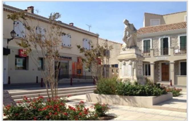
Châteauneuf-les-Martigues, Sa place centrale

Adossé aux contreforts de la chaîne de l'Estaque, Châteauneuf-les-Martigues sera votre prochaine destination. Idéalement desservie par de grands axes routiers, les habitants de cette petite ville ont la possibilité de travailler dans un large rayon sans perdre trop de temps dans leurs déplacements. Châteauneuf-les-Martigues est également connue pour son site archéologique de la Font aux pigeons qui a fait l'objet de nombreuses fouilles. Profitez-en pour visiter le musée des Amis du Castrum Vetus où ont été rassemblés une partie de ces fouilles datant de la préhistoire à la période gallo-romaine.