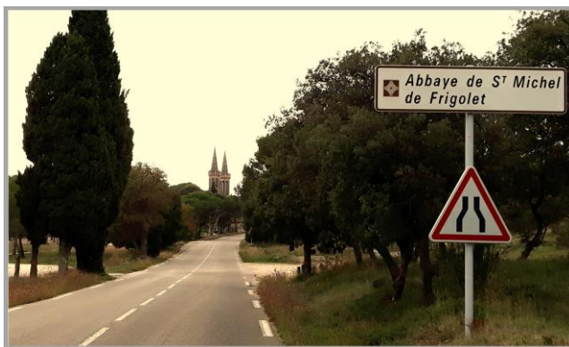
Abbaye de Saint-Michel-de-Frigolet

Par la D5, poursuivez vers Graveson, situé au pied du Massif de la Montagnette. Prenez le temps à Graveson pour visiter le musée des Arômes et du Parfum installé dans un beau mas du XIX ème siècle et pourquoi pas le musée Auguste Chabaud pour y découvrir l'œuvre de ce peintre qui vécut à Graveson et où il a peint, sculpté, et dessiné jusqu'à sa mort en 1955, depuis son mas près de la Montagnette.