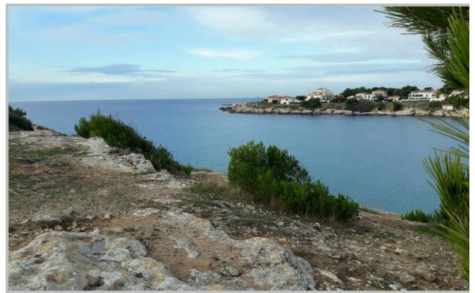
La Couronne, l'anse du Verdon

Ziem. Ce quartier a également été rendu célèbre par le tournage du film « La cuisine au beurre » avec Fernandel et Bourvil. Après avoir traversé l'île puis Jonquière, dirigez vous vers Lavéra en longeant le Canal de Caronte puis la zone Artisanale afin de récupérer la voie verte pour atteindre Lavéra sans difficulté routière. Avant de rejoindre le bord de mer à Carro, le circuit vous amène vers Saint-Pierre les Martigues, puis les Ventrons sur les hauteurs environnantes et le col de la Gatasse (127 m).