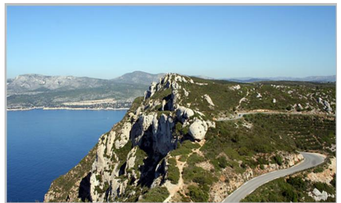
La route des Crêtes vers Cassis

Niché au pied d'une impressionnante falaise, Cap Canaille , Cassis, belle station balnéaire, va vous séduire par son port et ses quais animés bordés de cafés et de restaurants.