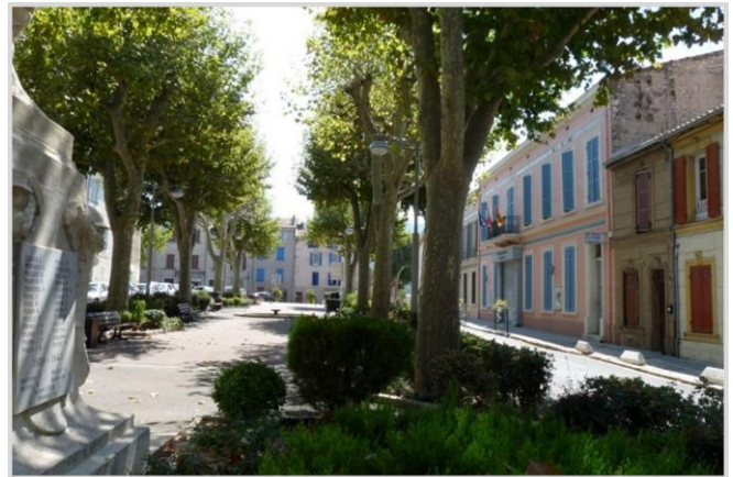
Saint-Zacharie, Cours Louis Blanc

de nombreuses fontaines. Les sources de l'Huveaune et des Naves situées à proximité permettent l'apport d'une fraîcheur pendant la saison estivale. Dans son passé, le village était réputé pour les céramiques qu'on y fabriquait. Il reste aujourd'hui quelques vestiges de ces anciens fours nous rappelant le souvenir de cette époque.