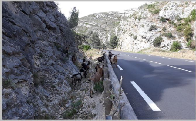
Vallon de l'Aigle, Troupeau de chèvres du Rove

construisit sa maison dans les années 1930, au dessus du petit port.