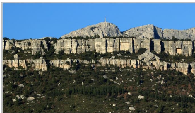
Barre du Cengle

A la sortie de Puyloubier, par la fameuse route de Cézanne dirigez vous vers le col du Cengle, pour franchir le plateau du même nom, barrière rocheuse longeant la Sainte-Victoire et séparée de celle-ci par la rivière le Bayon, pour plonger sur le village du Rousset.