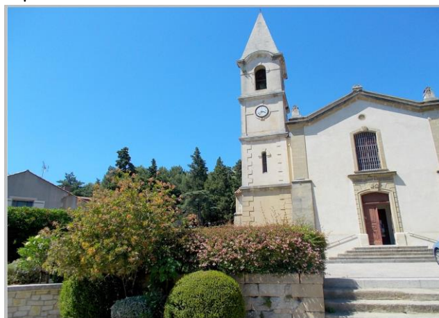
Lamanon, Place de l'église

Au passage, n'oubliez pas d'admirer le platane tricentenaire classé monument naturel : 53 m de haut et 10m de circonférence, ce n'est pas pour rien qu'on l'appelle ici « le Géant de Provence », impressionnant.