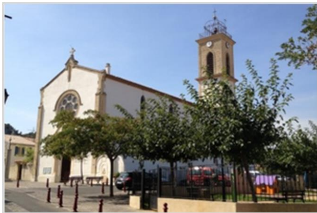
Châteauneuf-les-Martigues, Son église

A l'Estaque, connue pour ses célèbres panisses et mis en lumières par le grand réalisateur Robert Gédiguian à travers son film « Marius et Janette », vous serez déjà sur le chemin du retour de la randonnée. C'est par le chemin de la Nerthe, à l'entrée de l'Estaque que vous entamerez le retour en traversant la chaîne de l'Estaque vous ramenant vers Gignac-la-Nerthe. La belle église paroissiale à la façade rénovée et son beau clocher vous attendent en son centre ancien pour une petite visite. A vocation agricole dès son origine, Gignac-la-Nerthe est devenue aujourd'hui une cité dortoir pour les travailleurs des grandes bourgades des alentours.