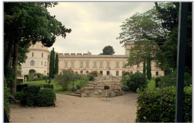
Barbegal, le château

Un dernier effort pour passer la colline vous sera nécessaire pour finir le circuit et retrouver votre point de départ à Fontvieille.