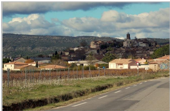
Pourrières, le village adossé à la Sainte-Victoire

A la sortie de Meyrargues, quittez la bruyante D96N pour remonter vers Peyrolles et Jouques par le chemin du Canal. A Jouques, une grosse moitié du circuit aura été effectuée et lors de la deuxième moitié vous allez savourer toute la beauté de la Montagne de la Sainte-Victoire. En quittant Jouques par la D11 vous entrez de plein pieds sur le grand site de France par le col du grand Sambuc. Puis profitez de la belle descente qui suit qui vous ramène dans la vallée de Vauvenargues, pour récupérer quelques forces. Les cols de Clap puis celui des Portes vous donneront un peu de fil à retordre avant de glisser vers l'extrémité Est de la Sainte-Victoire.